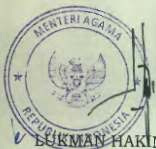
LUKMAN HAKIM SAIFUDDIN

MENTERI PENDAYAGUNAAN APARATUR NEGARA DAN REFORMASI BIROKRASI,